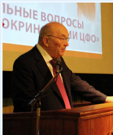
Академик Мартынов А.И.